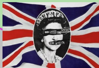
セックスピストルズの Tシャツデザイン

A.ある国とない国があります。アメリカでは抗議のために旗を燃やしても、無罪となっています。イギリスでは法律そのものはありません。